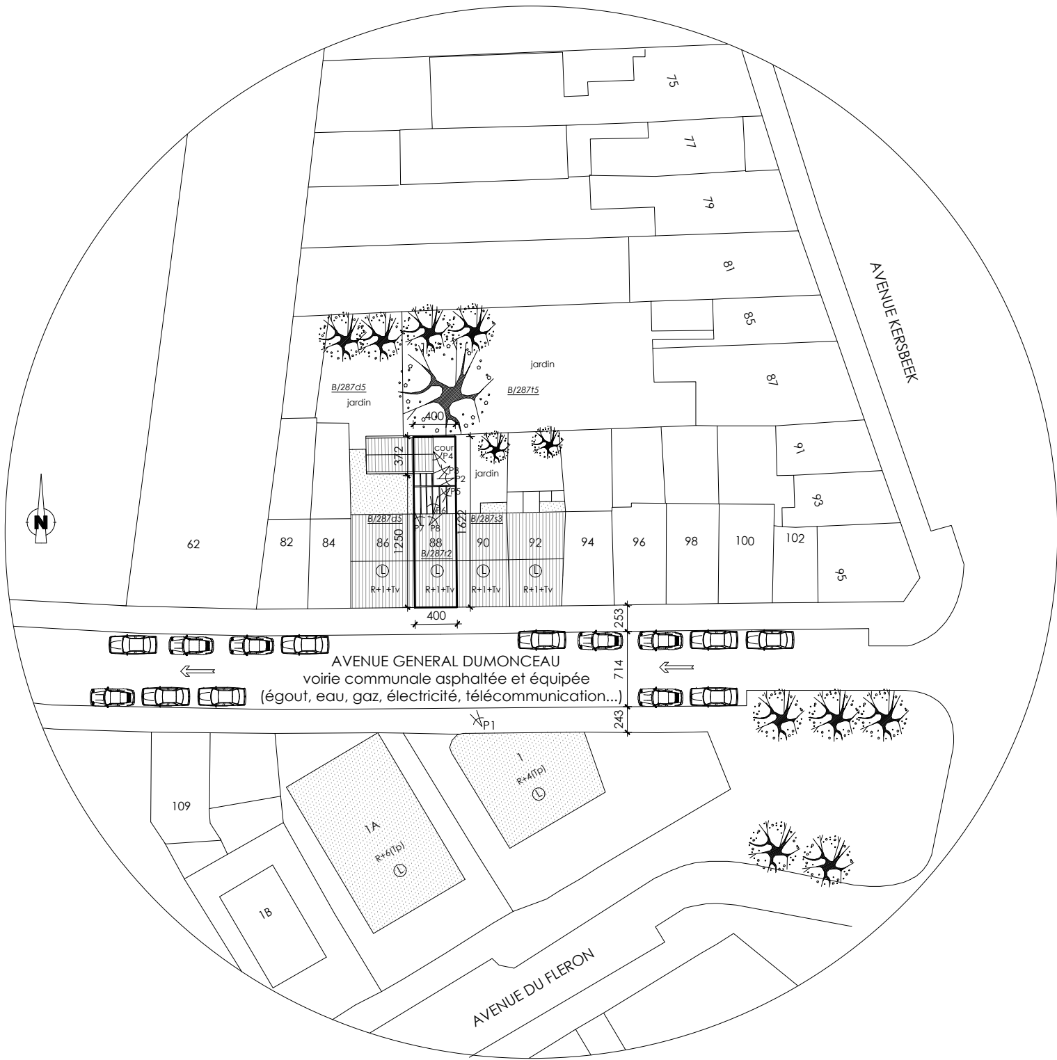
PLAN D'IMPLANTATION EXISTANT - 1/500