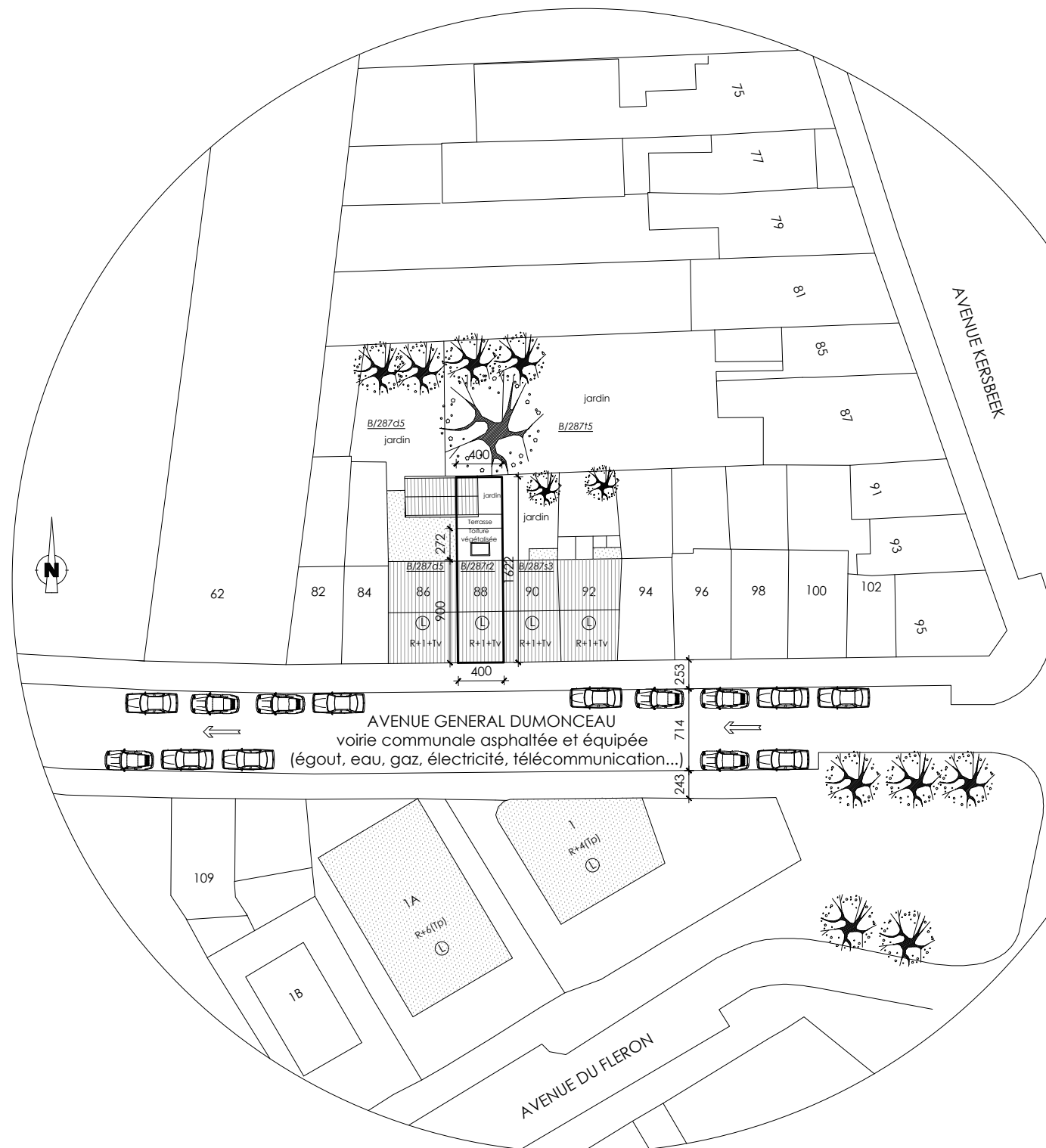
PLAN D'IMPLANTATION PROJETE - 1/500